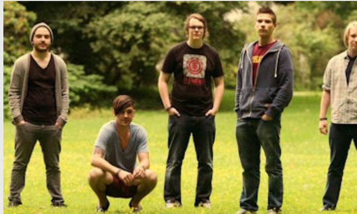
The Herbs

Eine kleine musikalische Kostprobe von "The Herbs" finden Sie hier .